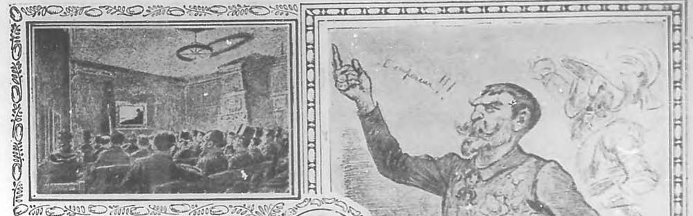
Cabaret del "Chat-Noir" durante una representación.

los cuales no tenían más don, que el de evocar sobre esta manelle du monde como dijo cómicamente el difunto Senlis, todo un pasado bucólico y primaveral.