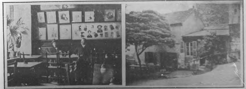
Interior del Cabaret des Quatz, Arts.