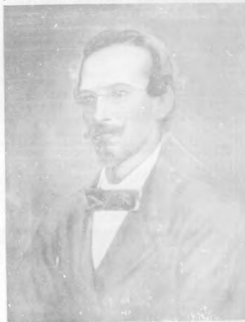
JOAQUIN LUACES, ilustre poeta cubano

Al mismo tiempo comunico esta grata noticia al autor, quien viajando por la Isla, la desconoce, me es grato partici-