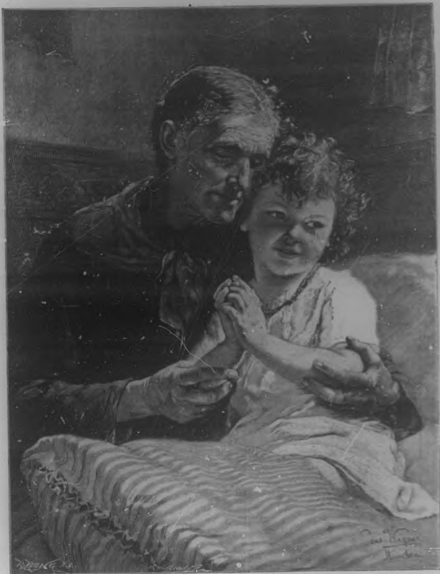
LA ORACION MATINAL.—Cuadro por P. Wagner.