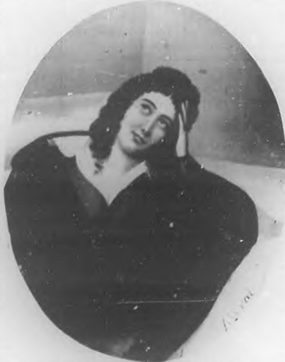
GERTRUDIS GÓMEZ DE AVELLANEDA