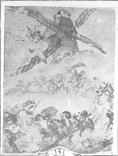
MOLINO DE LA "GALETTE". - Cuadro de A. Willette.

Antes de la desaparición del sacrificado, tres molinos se levantaban sobre el alto de la colina, pero preciso es confesar que no eran sino molinos decorativos, silenciosos, paráliticos,