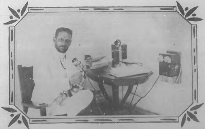
La entrevista es interrumpida varias veces por las llamadas telefónicas que hacen al Presidente sus Secretarios de despacho.