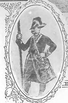
Portero del "Chat-Noir".

Ahora bien, para terminar diremos, que el más importante de estos tres molinos, es el que al principio de esta reseña decimos que fué visitado por Etienne Marcel se denomi-